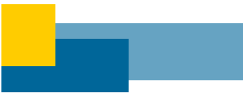
La semaine / Jennifer Febvay